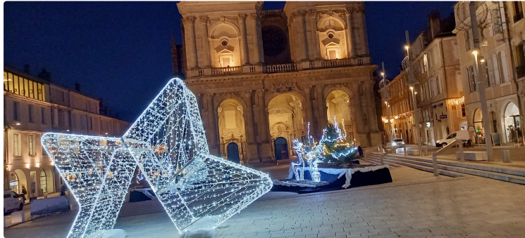
Le parvis de la cathédrale donne le ton des illuminations de la ville d'Auch

Après le renne qui traînait le charriot du Père Noël, puis le puissant ours qui impressionnait au milieu du parvis de la cathédrale, cette année « c'est une étoile géante qui fait office de porte d'entrée vers un monde féérique composé de trois scénettes avec ses sapins agrémentés de guirlandes lumineuses et ses rennes du plus bel effet », détaille Cathy Daste-Leplus adjointe au maire d'Auch. A noter aussi la présence de deux grosses boules lumineuses de plus de 2,50 mètres de diamètre entièrement réalisées par les agents du service Manifestations de la ville d'Auch. Cathy Daste-Leplus précise que « ce décor extraordinaire est plus particulièrement l'œuvre d'un agent qui a exercé la profession de décorateur pour Disney ».