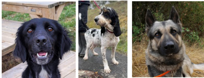
Les stars de la semaine : Dora, Polux et Chinky

Cette semaine, la SPA vous présente trois nouveaux venus qui ont hâte de vous rencontrer.