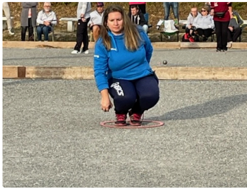
petanque mirande 6.jpg