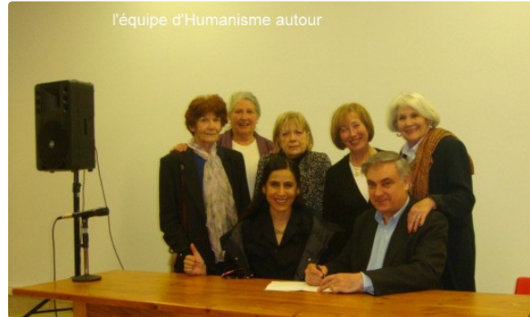
Humanisme en Fezensac et Cine Qua Non présentent "L'ombre de Goya"

Le vendredi 18 novembre l'association Humanisme en Fezensac avec le concours de Cinéquanon présente le magnifique film documentaire L'Ombre de Goya de José-Luis Lopez- Linares réalisateur et Jean Claude Carrière scénariste.