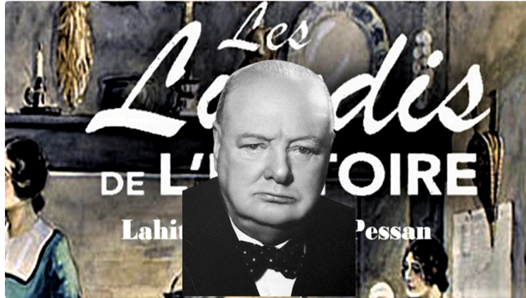
Lundi 7, CHURCHILL, le Lion à Lahitte.