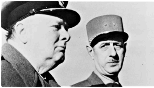
Avec De Gaulle