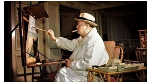
Il était aussi un excellent peintre.