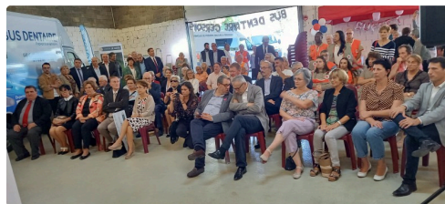
De nombreux élus étaient présents.