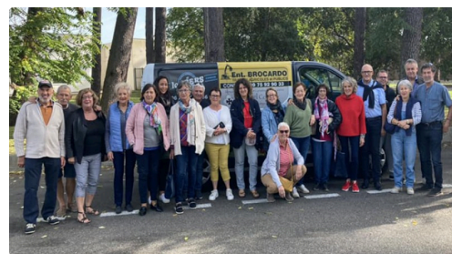
condom toro jumelage (7).jpg

Prochaine rencontre, en terre condomoise cette fois, en mai prochain.