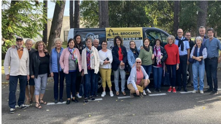
Jumelage : La fête des vendanges hors frontières