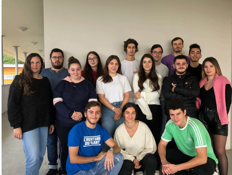
Foire aux oies de Riguepeu : les étudiants en BTS de Beaulieu investis dans son organisation

La traditionnelle Foire aux Oies de Riguepeu se déroulera