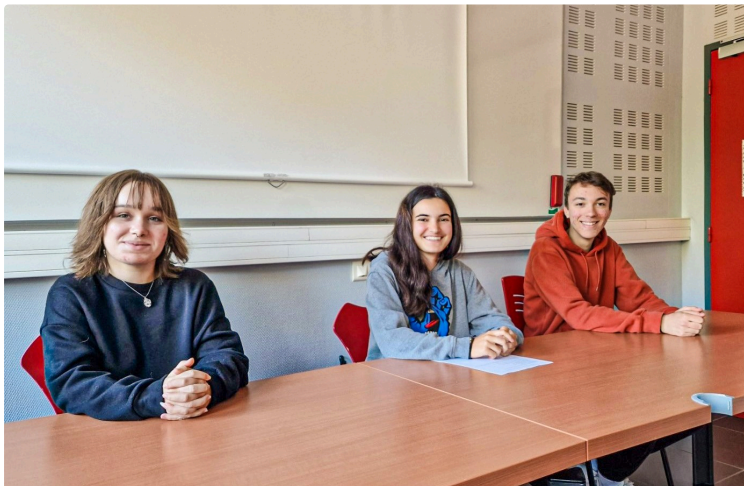
«Les HalluCinés» développent le cinéma à Nogaro

La junior-association en assemblée générale