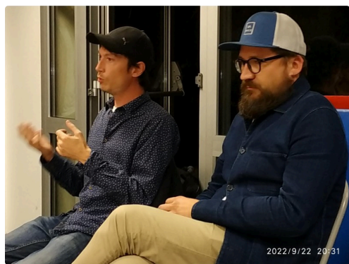
1663916671405 - Copie.jpg

Rendez-vous à l'Astrada à 18h30. Vendredi 23 septembre 2022 à 18h30. Entrée libre.