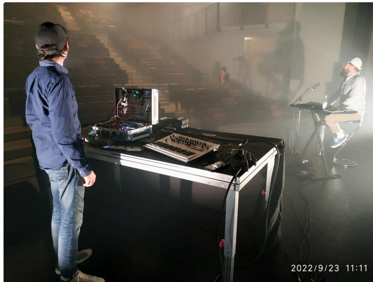
Marciac L'Astrada : sortie de résidence.

Vendredi 23 septembre 2022 à 18h30. Entrée libre.