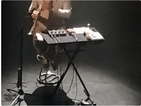
1663924968416 - Copie.jpg