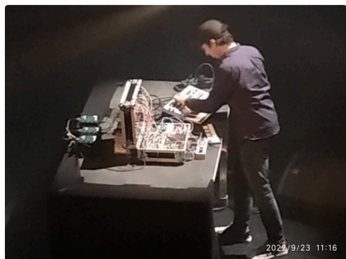
1663924990758 - Copie.jpg