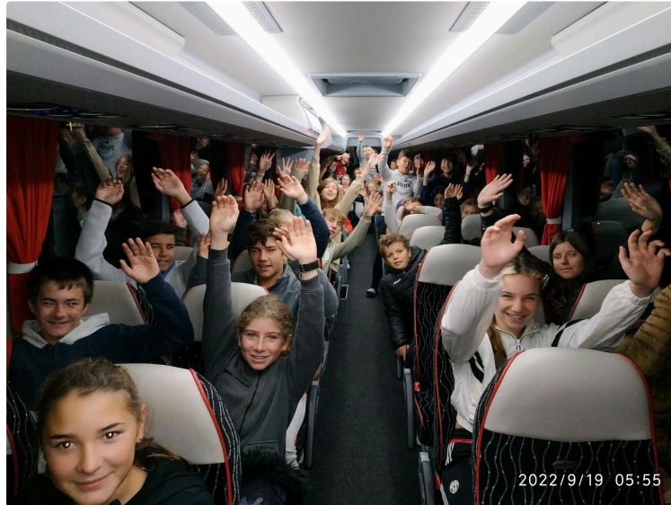
De jeunes gersois à la découverte de la vulcanologie.

Collège Aretha Franklin : séjour en Auvergne et au Parc Vulcania.