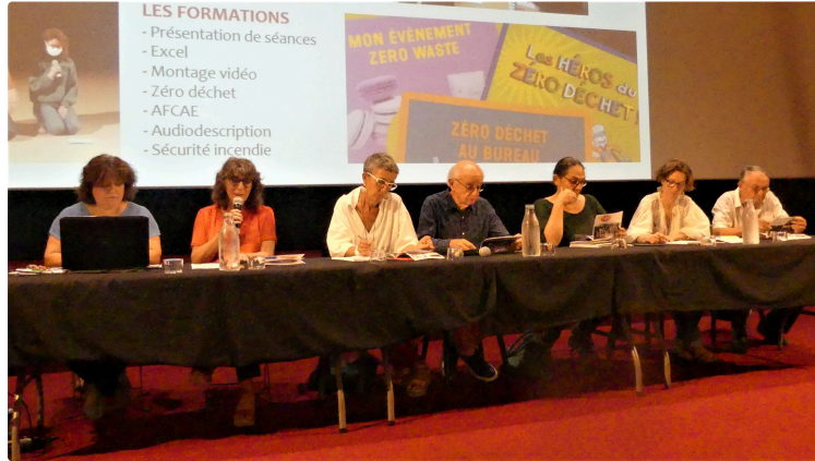
CINE32 poursuit sa route ...