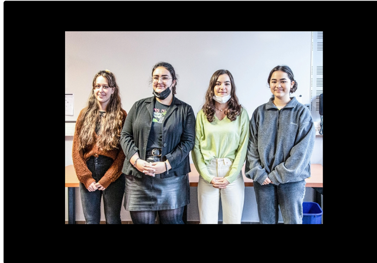
Deux juniors-associations du lycée de Nogaro en assemblée générale

Les Hallucinés et Un Livre dans la poche