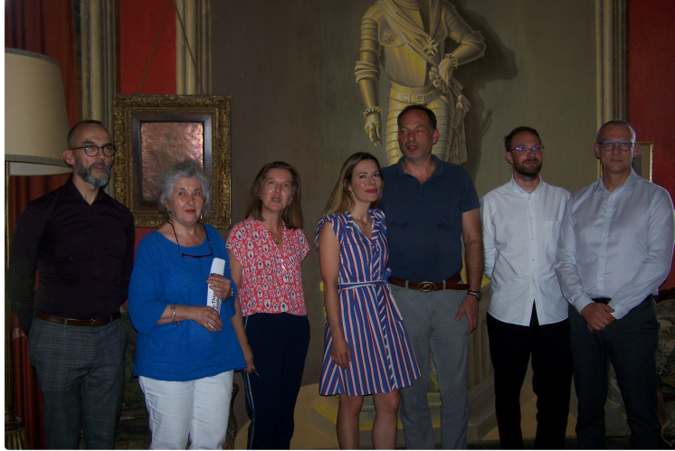
Des Cadets de Gascogne aux Mousquetaires du Roi : un événement culturel et artistique unique sur le territoire du Savès