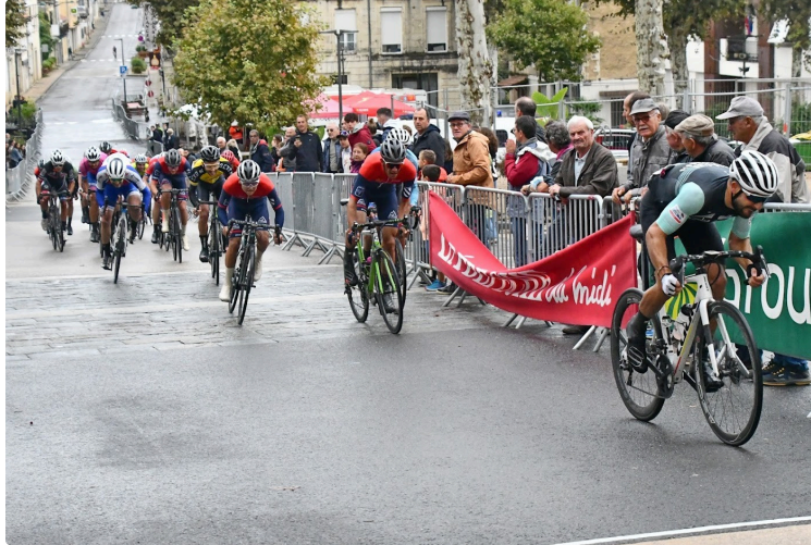
La fête de la Saint Matthieu, c'est le week-end prochain !

La traditionnelle fête de la Saint-Matthieu se déroulera du 17 au 20 septembre 2022 à Vic-Fezensac.