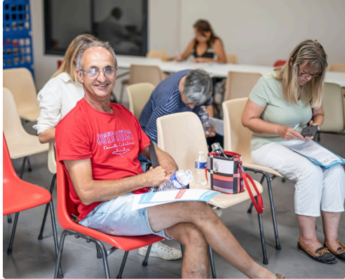
4e étape : attendre la consultation avec un médecin