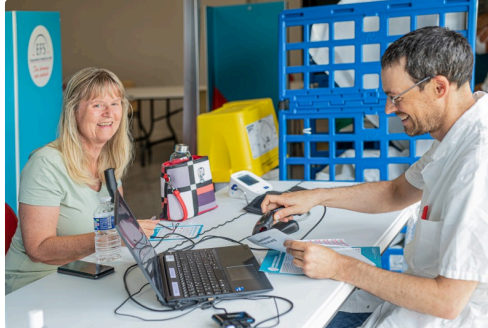
5e étape : consultation