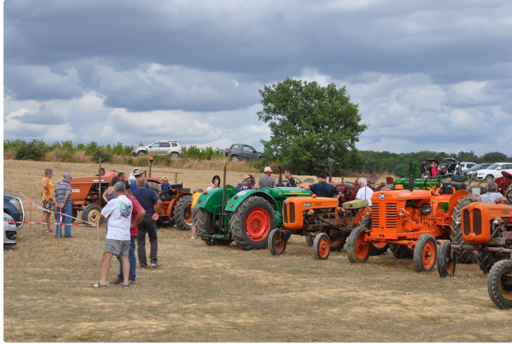
Quand vieux tracteurs et blindés passent un dimanche ensemble !

À Lagardère, une association de passionnés de vieilles mécaniques agricoles, l'AMAA (Association des Moteurs Anciens en Action) organise chaque année un rassemblement sympathique de passionnés des vieux engins.