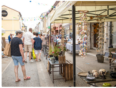
5 Bas de rue de la République 1bis 130822.jpg