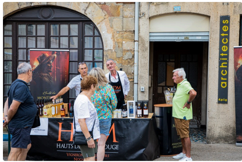
Stand de HDM