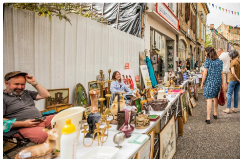
1 Rue de la République 1bis 130822.jpg

Ce petit album cherche à rendre l'ambiance ou a lieu cette manifestation.