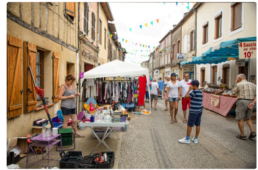
6 Bas de rue de la République 1bis 130822.jpg