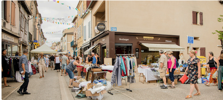
Fête du floc et vide-grenier à Nogaro samedi 13 août

Si le nombre d'exposants a un peu diminué pour ce vide-grenier, par rapport à ceux des années précédentes, le public curieux et avide de découvertes est présent comme à l'accoutumée ce samedi 13 août.