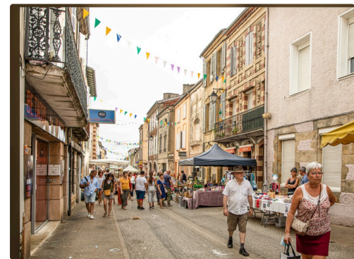
3 Bas de rue de la République 1bis 130822.jpg