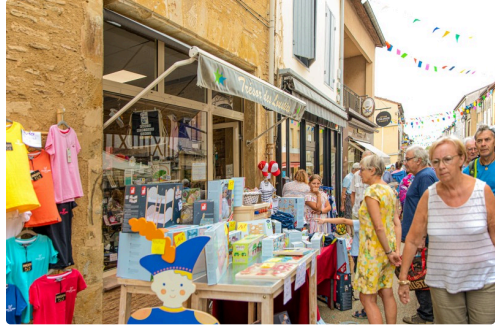
7 Bas de rue de la République 1bis 130822.jpg