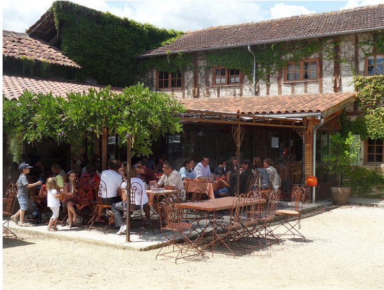
Comme une journée de vacances en passant par l'auberge de l'Aoueille