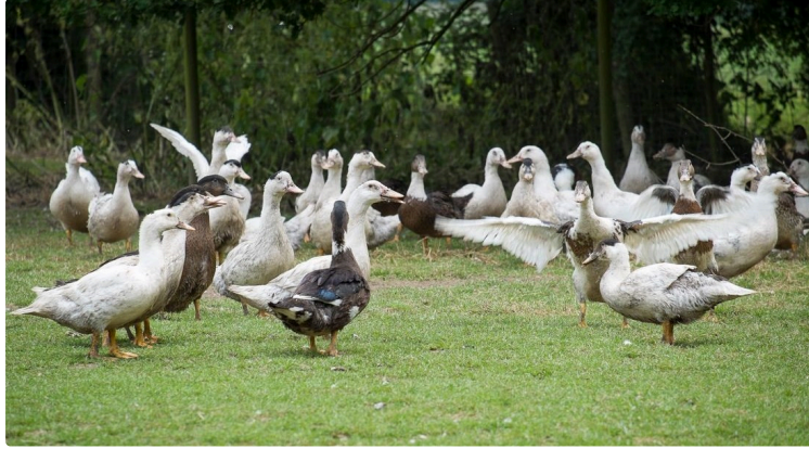
Une panoplie de mesures pour lutter contre l'Influenza aviaire

Communiqué du ministre de l'Agriculture et de la Souveraineté alimentaire