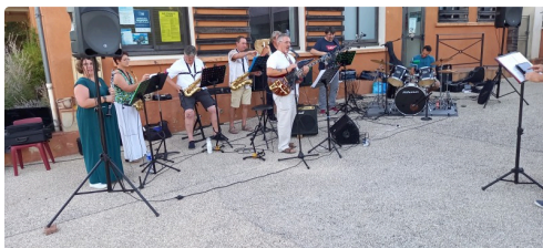
Un orchestre a égayé la soirée.