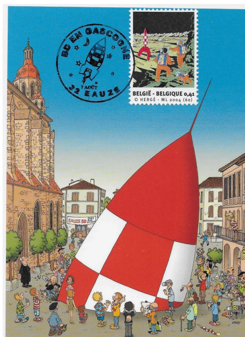
Carte créée par Ernst.