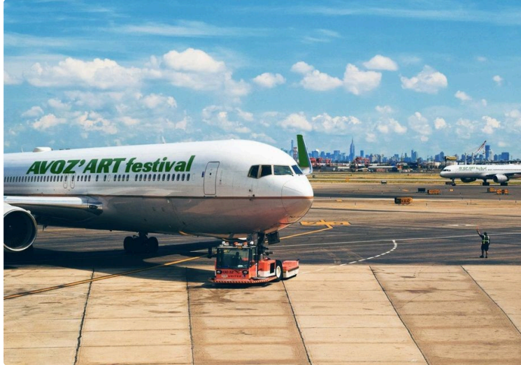
Le festival de sculpture Avaz'Art ouvre ses portes samedi : rencontre avec sa présidente !

A pied, à vélo, en voiture... ou même en avion privé spécialement affrété pour l'occasion ( !!! ), tous les modes de locomotion sont bons pour se rendre au festival Avoz'Art qui ouvre ses portes samedi 30 juillet à 10 h à Mourède !