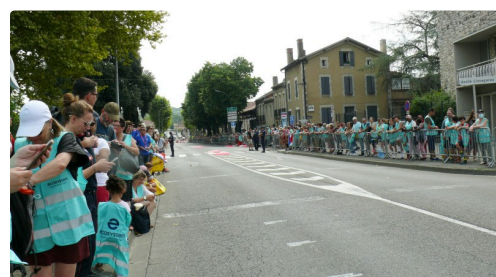
Les spectateurs avenue Hoche.