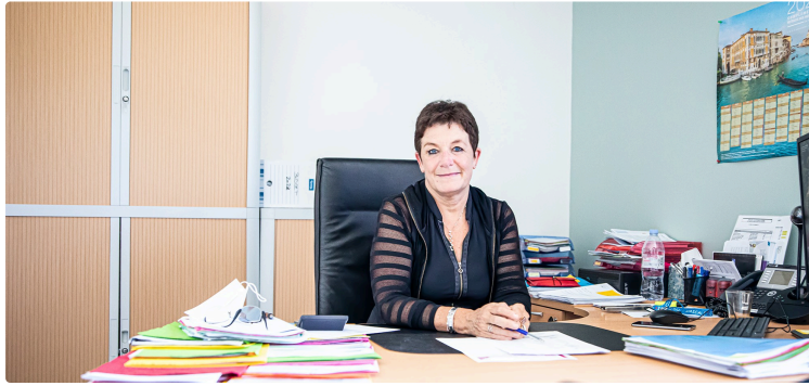
Rencontre avec la directrice de l'hôpital de Nogaro

Un hôpital labellisé « hôpital de proximité »