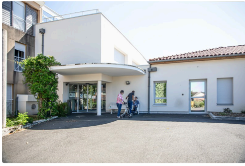
Entrée principale actuelle de l'hôpital de Nogaro