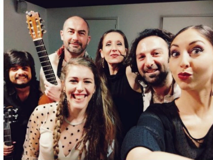
Le groupe flamenco Azulenca, c'est vendredi soir à Rozès !

L'association culturelle de Rozès Confluences présente un concert du groupe de flamenco Azulenca