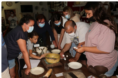
3556_MUSEE Paysan Emile_EscapeGame_29-7-2021.JPG

15, arrua Marceau - 32000 Aush - media.gasconha@gmail.com