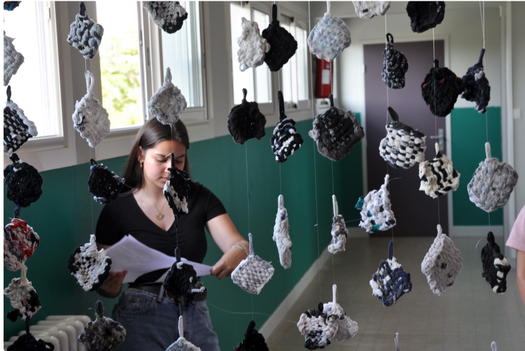
Collège Gabriel Séailles : une clôture de résidence d'artiste pleine de poésie et de fantaisie