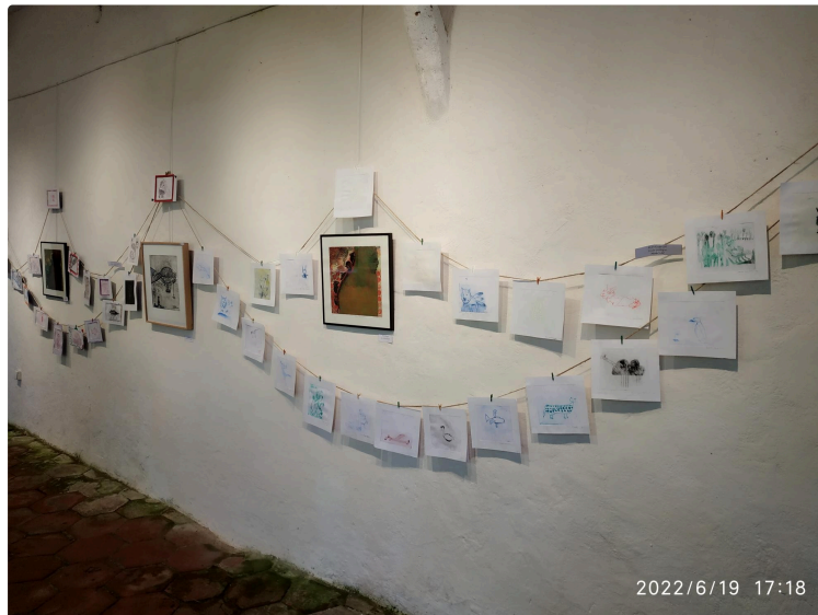
Marciac: A la découverte des gravures.

L'Âne bleu met en lumière les créations des élèves de Marciac.