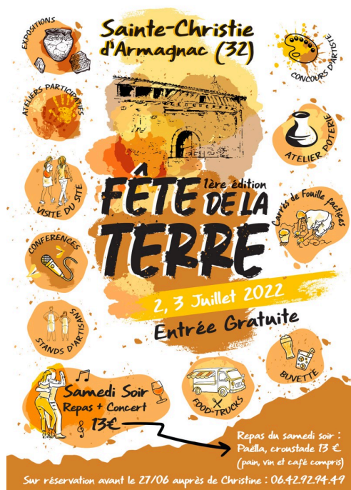
Prospectus du programme de la Fête de la terre