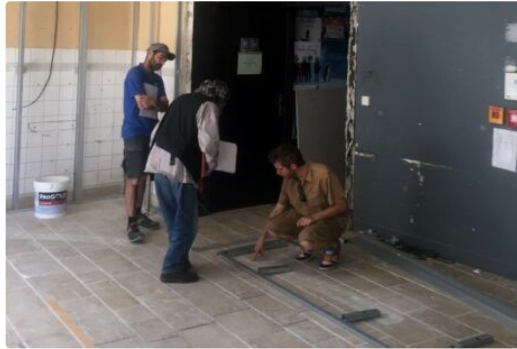
le Sénéchal s'embellit

En accord avec l'association ciné 32 qui les attendait avec impatience, des travaux ont été engagés à la Salle du Sénéchal – Cinéma de Lecture – pour agrandir le Hall d'Accueil.