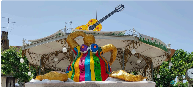
Label de Nuit a fêté ses 10 ans autour de La Belle de Nuit !

Créée en janvier 2012 à Vic-Fezensac, l'association Label de Nuit, association d'animation culturelle intergénérationnelle fêtait samedi ses 10 ans.