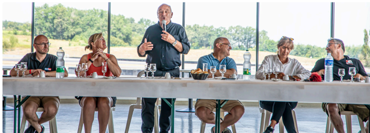
Grand Prix Camion au circuit de Nogaro : 3 jours de fête

Parades de camions décorés ; spectateurs des courses sous vigilance sanitaire canicule