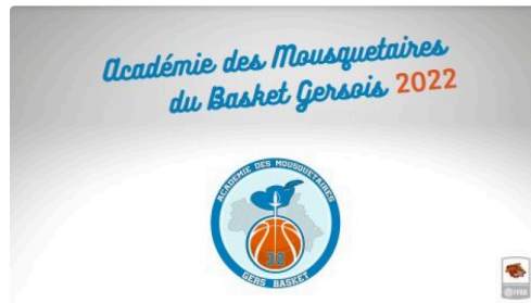
Logo Académie des Mousquetaires Gersois.