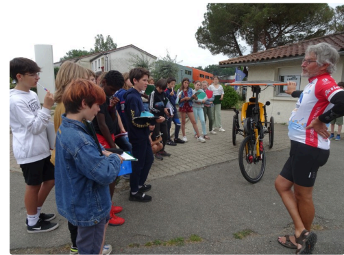
Les élèves découvrent un engin surréaliste

Article et photos de Madame Brouzes, enseignante au collège Aretha Franklin de Marciac.