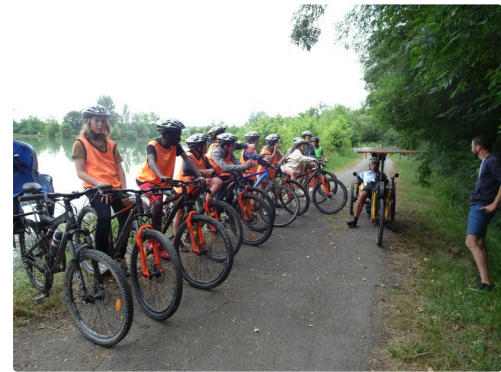
Démonstration du TiltDragonFly