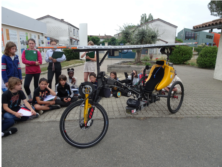
Le TiltDragonFly de passage à Marciac