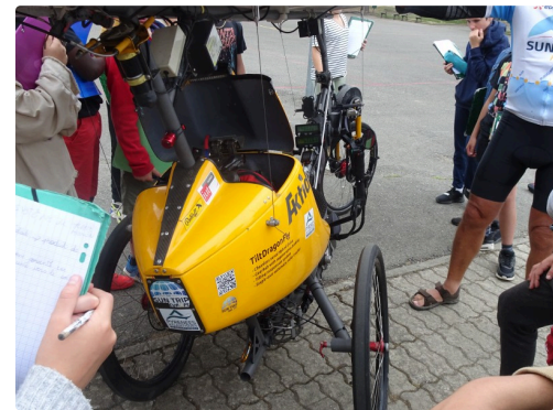
Leçon de technologie pratique