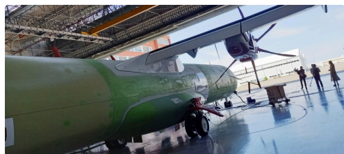
Prêt à peindre.

Carole Delga conclura que « toutes ces mesures financières ont pour but de soutenir la filière de l'avion vert mais pour autant le train reste indispensable ».