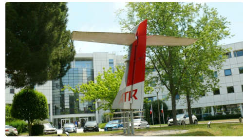
L'entrée du site ATR.