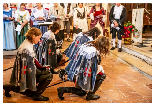
Arrivée de d'Artagnan à la messe en gascon à Lupiac en 2019