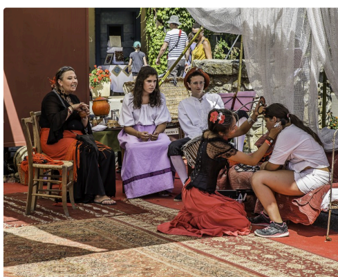
Le campement des bohémiennes en 2016