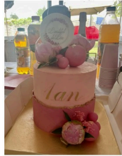
L'Institut de Léa fête son premier anniversaire !