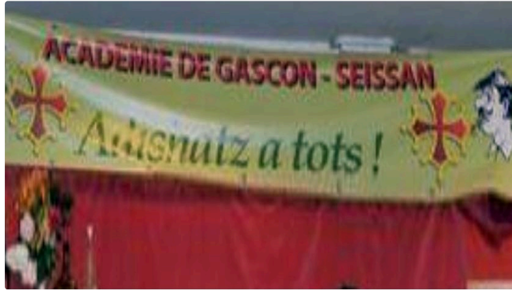
Le Gers, premier département à avoir organisé la concertation pour l'avenir des langues régionales

Il est temps de mettre en place des mesures efficaces