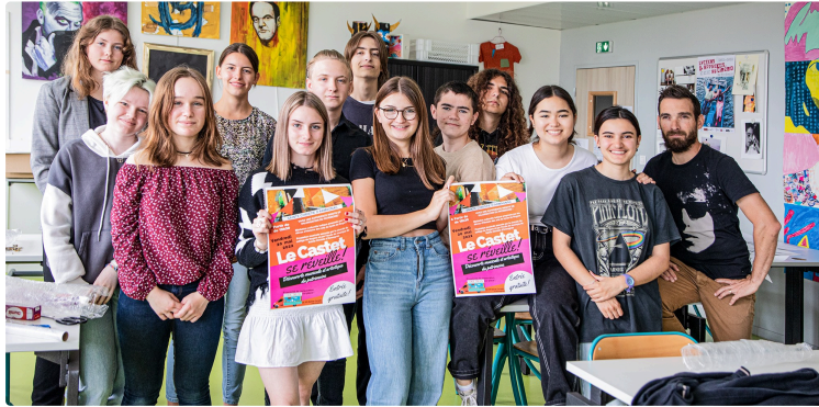
Sainte-Christie-d'Armagnac : mise en valeur insolite du patrimoine par des lycéens

Des animations à la motte castrale, au Castet, à la Manse, à l'église