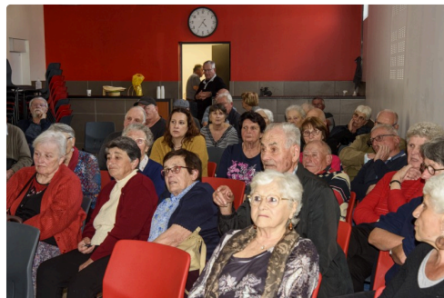
Le public pendant la projection.