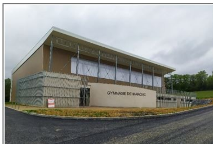
Un budget équilibré un endettement mesuré