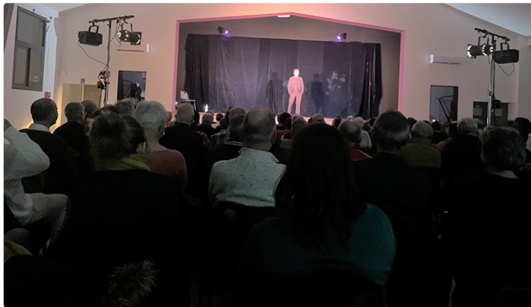
le spectacle « d'ICI ! » à fait le plein