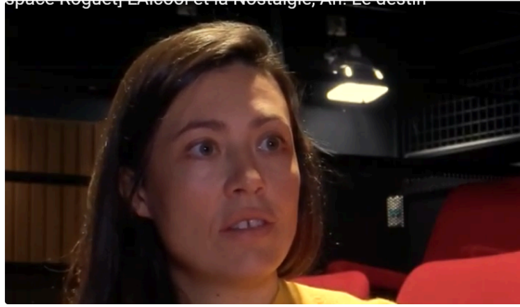
"L'alcool et la nostalgie" à l'Astrada.

Théâtre découverte : voyage introspectif à bord du transsibérien.