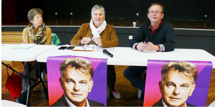
Le PCF 32 se penche sur la santé