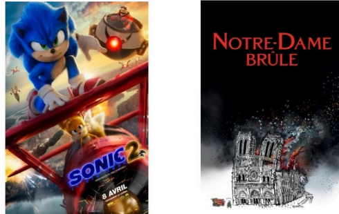
Animation et drame au cinéma dimanche