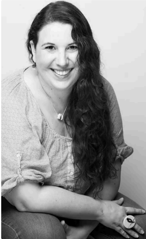
Screenshot 2022-04-02 at 15-01-25 Talavera015.jpg (Image WEBP 570 × 630 pixels).png