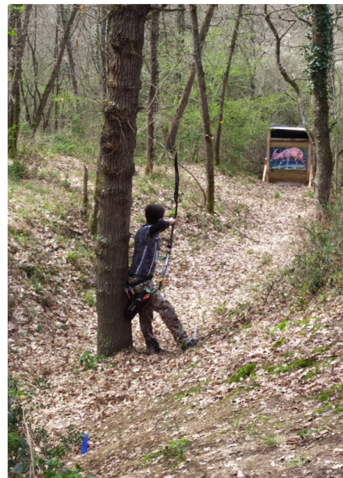
Chayan sur le parcours de Daux.jpg