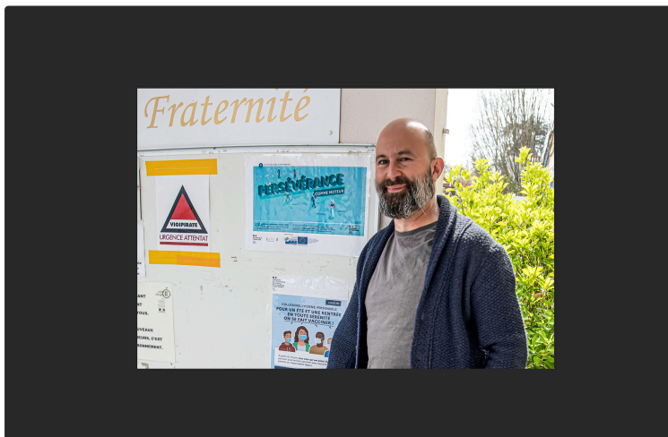
Rattraper les élèves décrocheurs du lycée de Nogaro (mis à jour le 07.04.2022)

Les reconforter, les aider à se diriger et à décider : depuis 5 ans déjà