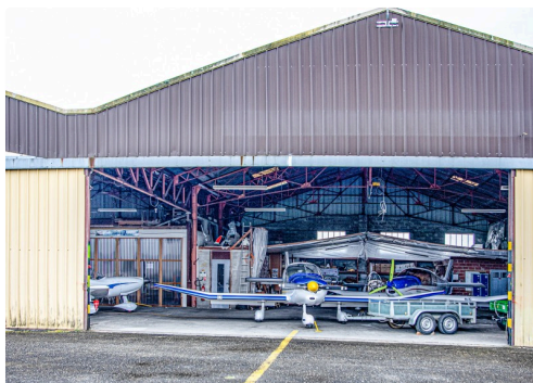
Autre hangar de l'aéro-club